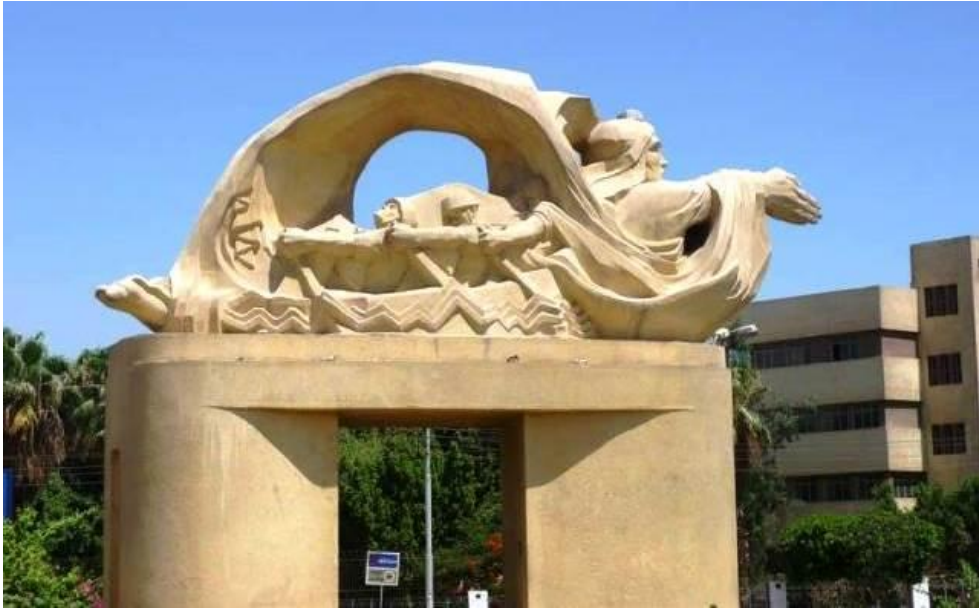
تمثال ميدان العبور بمدخل مدينة بني سويف للمثال جمال السجيني شكل (٣)

وقد عبر الفنان عن انفعاله بالحدث الذي أنجزته القوات المسلحة، بالانسان المندفع بكل قواه عابرا ومخترقا الحواجز الطبيعية والصناعية. وقد صور رمز العبور بهذا الشخص الذي يندفع بكل عزمه للعبور، في شكل قارب يحمل مجموعة من الجنود يجدفون. وقد نجح في التعبير عن رمز الإصرار علي تنفيذ المهمة التي كللت بالنجاح وهي العبور.